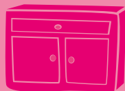
LES MEUBLES DIVERS USAGÉS