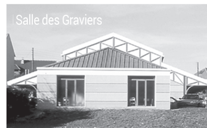
Salle des Graviers