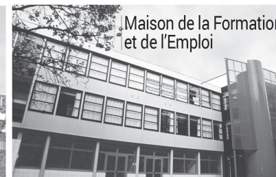
Maison de la Formation et de l'Emploi