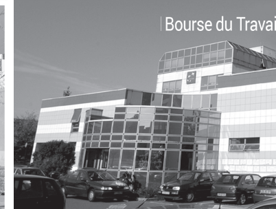
Bourse du Travail